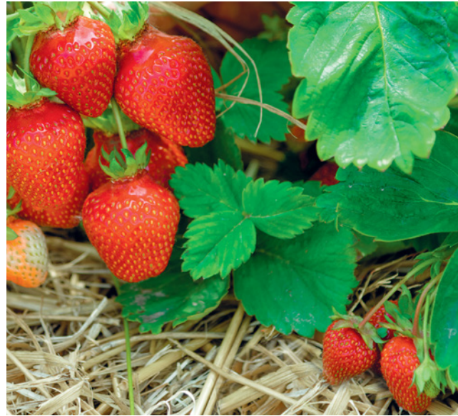
Eine Erdbeerpflanze vermehrt sich durch Ausbildung von Ausläufern, die ein Stück von der Pflanze entfernt im Boden Wurzeln bilden.