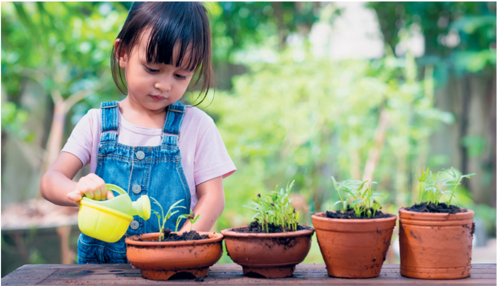
Im Garten können Kinder das Gießen übernehmen.

Die Feuchtigkeit der Erde ist nicht nur für die Wurzeln wichtig, sondern fördert zusätzlich die Fotosynthese, denn die Feuchtigkeit öffnet die Poren der Blätter. So profitiert die gesamte Pflanze von regelmäßigem Gießen, der Nutzen beschränkt sich also nicht nur auf die Wurzeln.