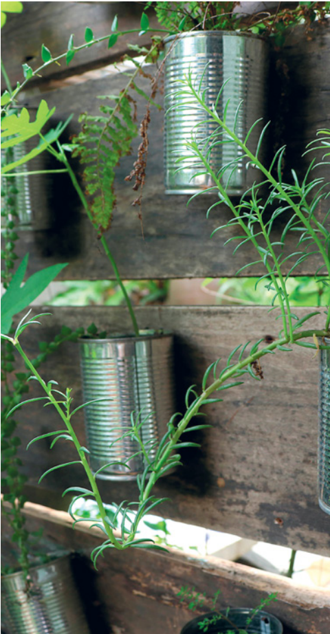
In Konservendosen umgetopfte Pflanzen