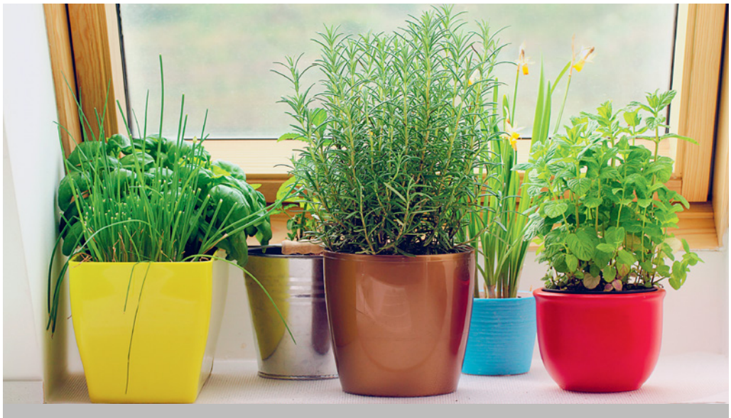
Ein Fensterbrett ist der ideale Ort für die Nachzucht von Gemüse.

Wer im Freiland pflanzen möchte, sollte dies in den wärmeren Jahreszeiten wie Frühjahr und Sommer tun.