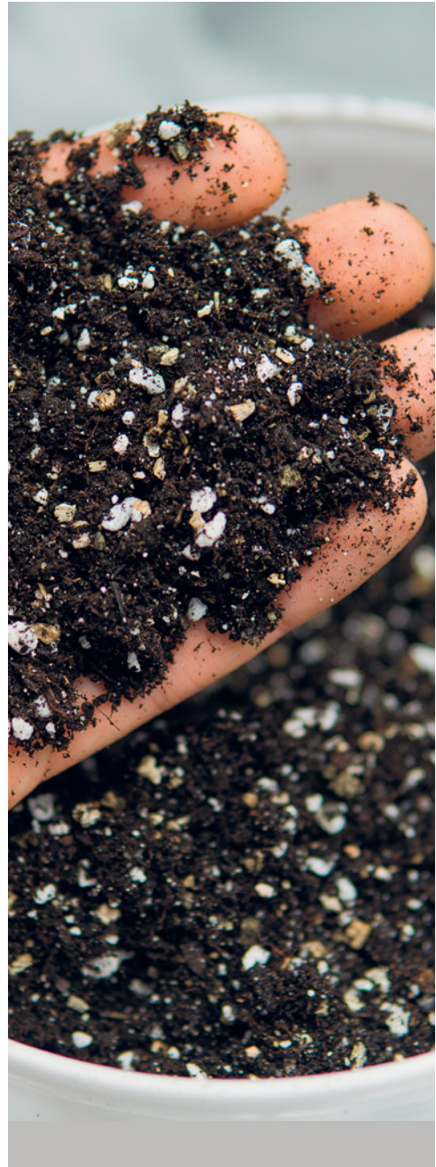
Gartenerde ist ideal: Der Boden ist dann locker, gut durchlüftet und kann Wasser speichern.

Es ist gut, wenn Sie den pH-Wert des Bodens in Ihrem Gemüsegarten kennen. Tester gibt es in jedem Gartencenter. Bei einem zu alkali-