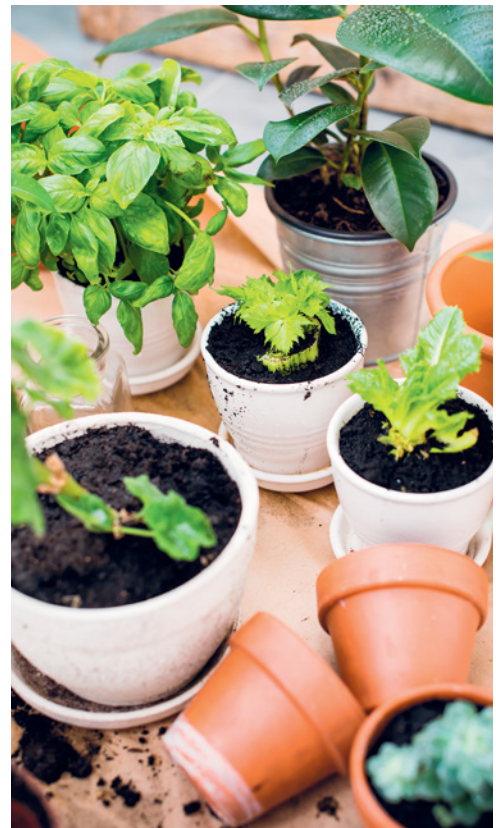
Das Umtopfen ist sehr wichtig, damit sich die Pflanze gut entwickeln kann.

Die Pflanzen erkennen den Wechsel der Jahreszeit. Natürlich wird das Licht weniger. Wenn Sie jedoch Kompost zuführen und regelmäßig gießen, wird dies keine Auswirkungen haben. Das Gießen ist gerade im Winter entscheidend, denn die Luft ist trockener (vor allem, wenn geheizt wird) und die Pflanze braucht Feuchtigkeit, um ihre Fotosynthese zu optimieren. Denken Sie also daran, gut zu gießen.